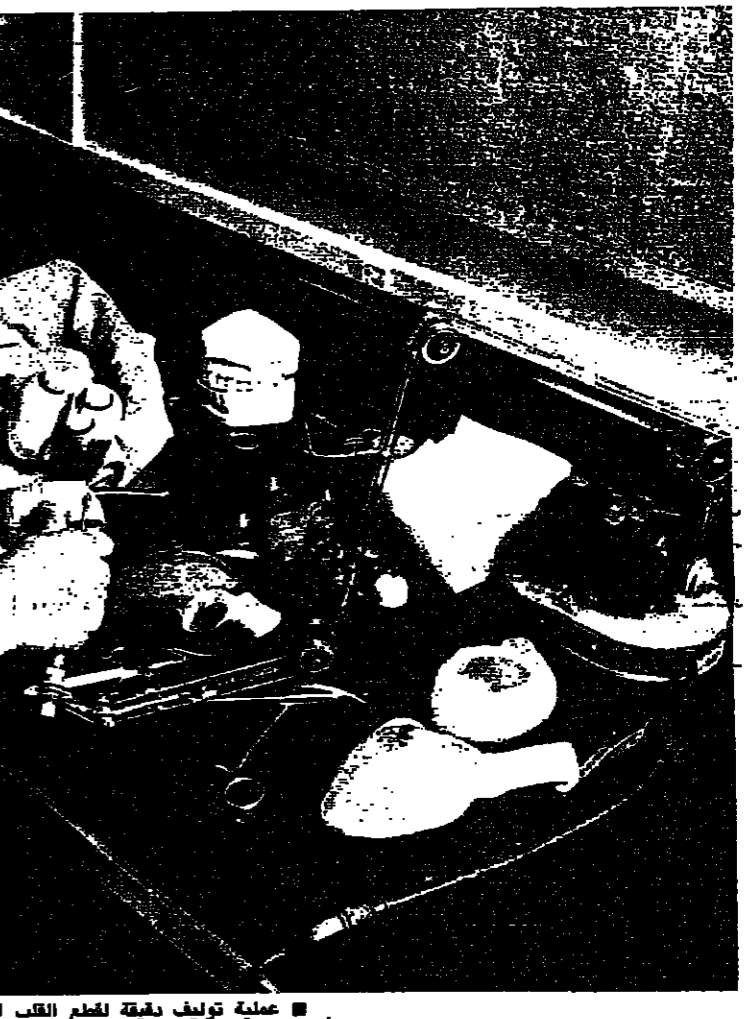
عمليّة توليف طبقة لطع القلب الاصطناعي: التعقيم والمعالجة